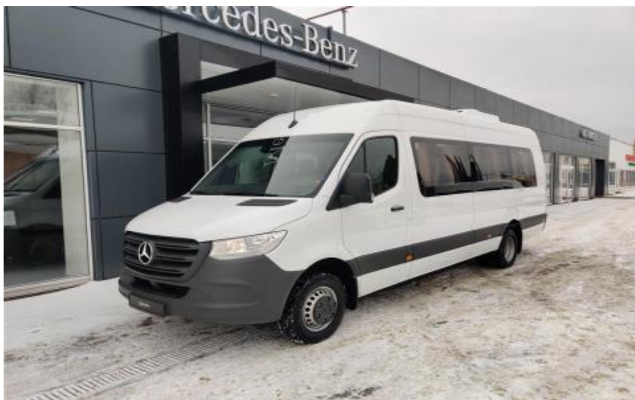
Mercedes-Benz Sprinter 516 CDI