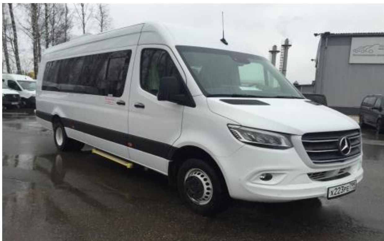
Mercedes-Benz Sprinter VS30 Tourist Ultimate